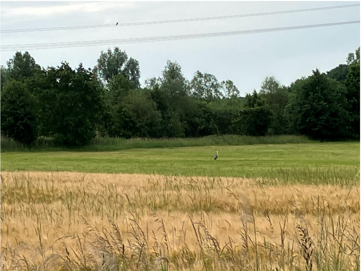
Der Reiher auf der Wiese macht einen langen Hals, um zu schauen wer da kommt.