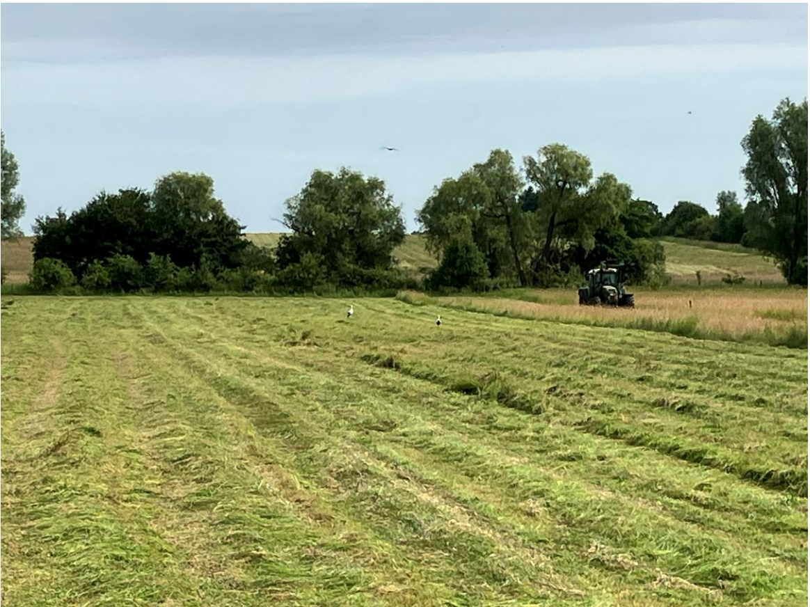
Die Wiese wird gemäht und die Störche schauen was es zu holen gibt.