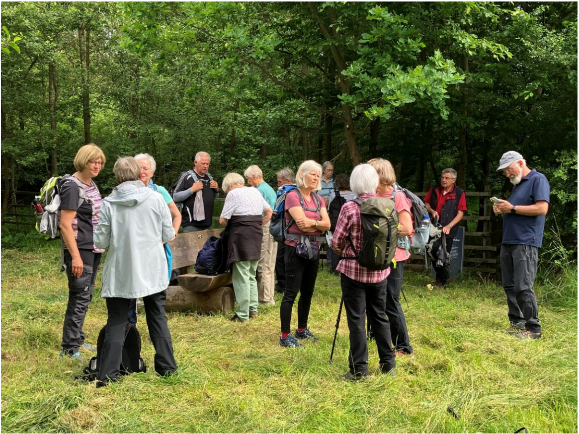
Eine geschützte Ecke im Wald mit Bank lädt zu einer Pause ein..