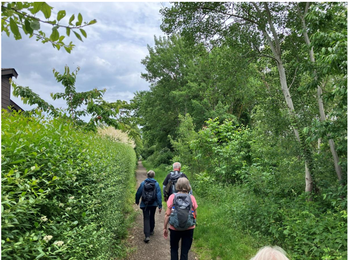
Bei so viel schönem Grün nehmen wir das letzte Stückchen Weg ganz locker.