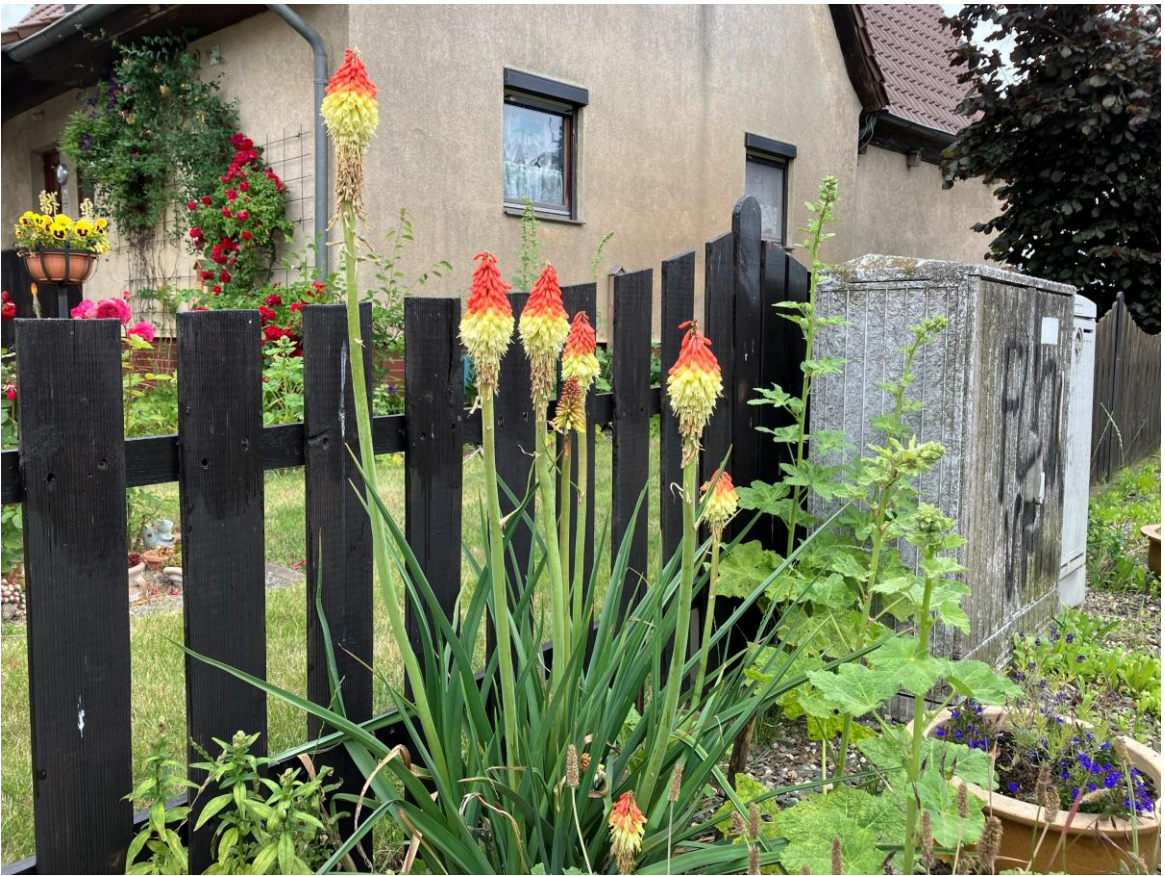
In den Vorgärten blühen die Fackellilien.