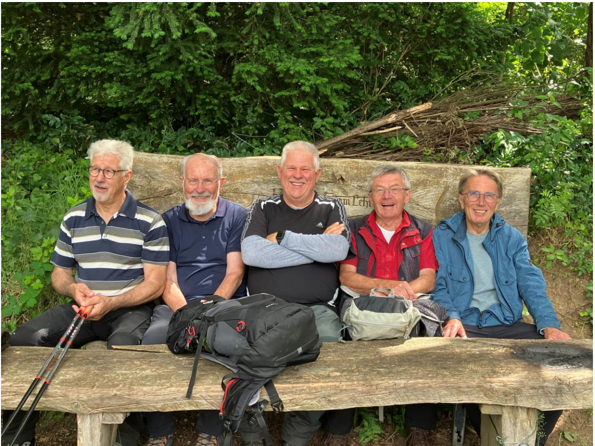
Eine Bank wie für uns gemacht.