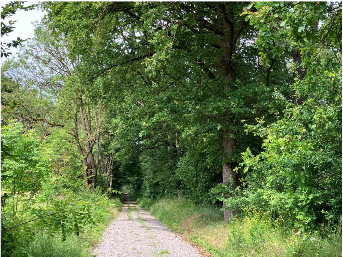
Die lange Gerade nehmen wir doch mit links!!!!!!!