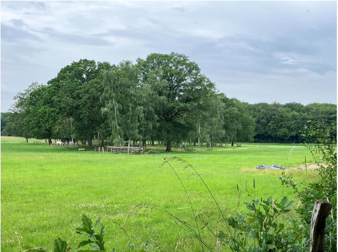
Ein malerisches Idyll. Baumgruppe mit Kuh in der großen Wiese.