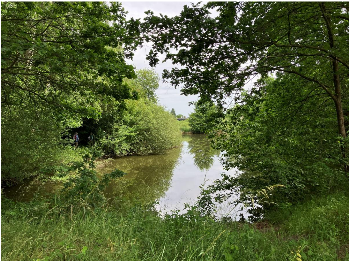
Vor uns liegt der Waldsee. Er wird vom Klub der Braunschweiger Fischer bewirtschaftet.