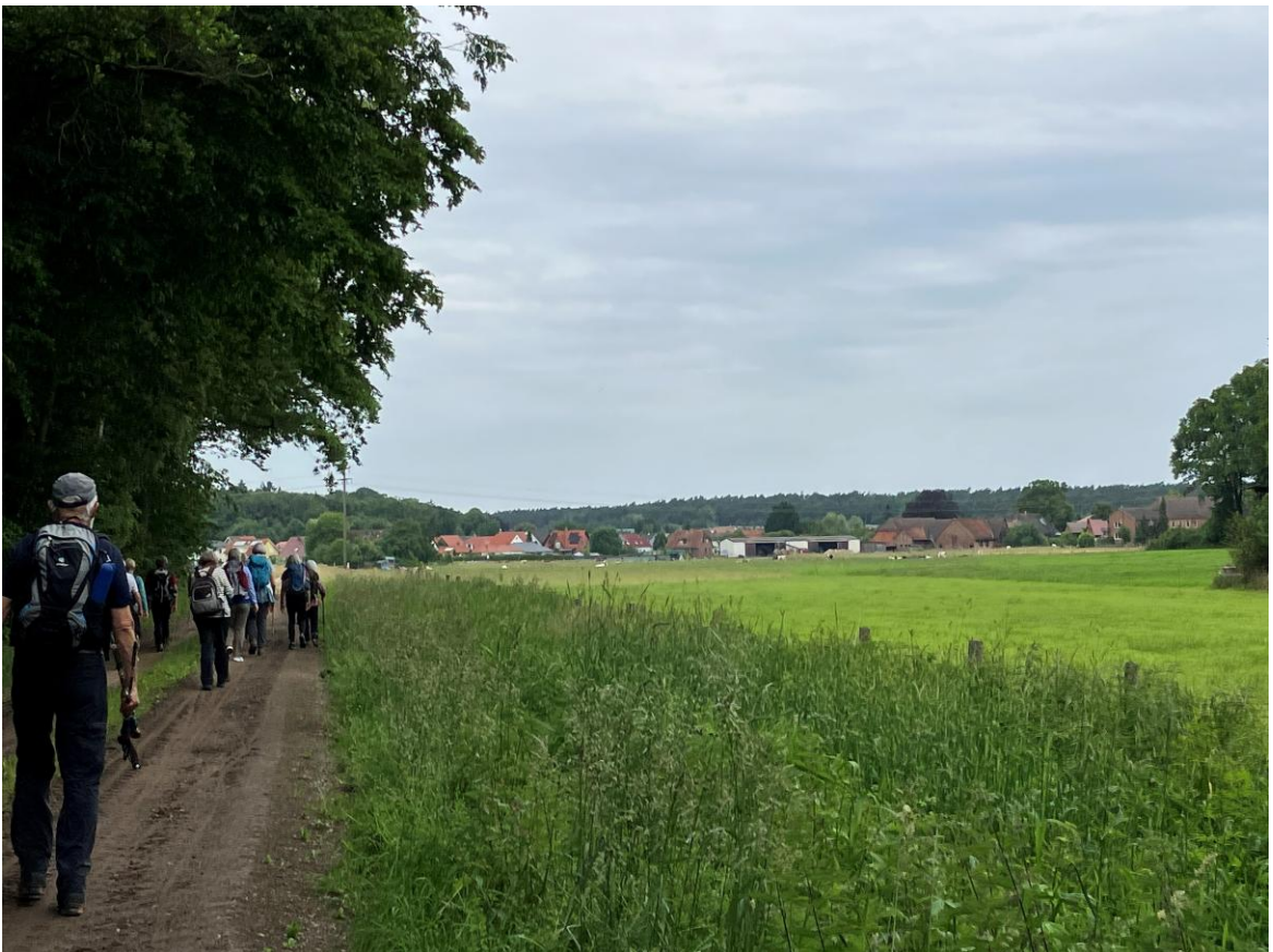
Vor uns ist schon Essehof zu sehen. .