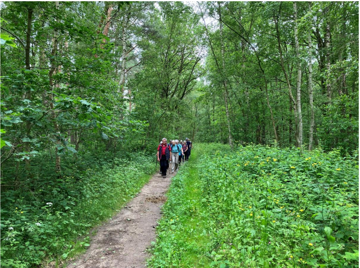
Kurz nachdem wir Essehof hinter uns gelassen haben tauchen wir wieder in den Wald ein..