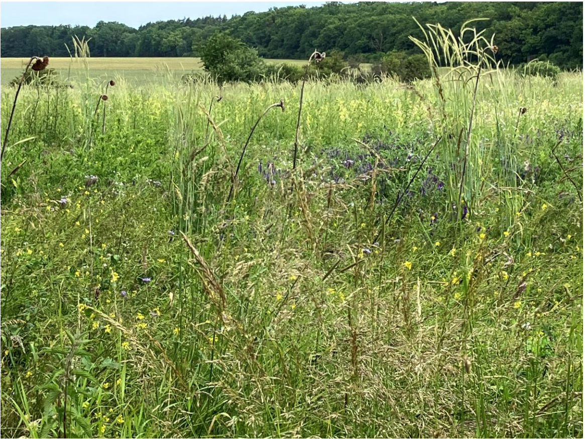
Links und rechts des Weges begleiten uns „Wiesenblüher“.