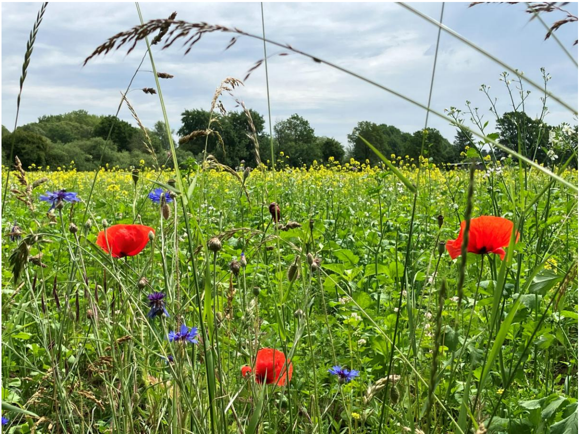
Bunte Wiesenblüher wie Kornblumen, Klatschmohn, Gräser und gelbe Zwischenfrucht auf dem Feld.